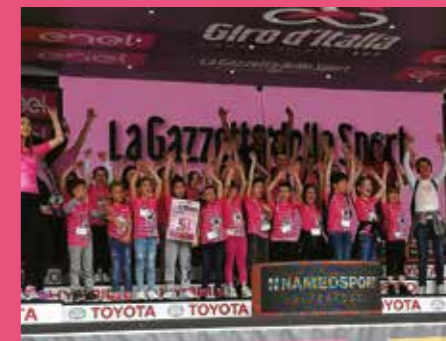
Classi 1B e 2B della Scuola Primaria Farsetti vincitrici del concorso "BICISCUOLA" in occasione dell'arrivo a S. Maria di Sala della 18 a tappa del giro d'Italia il 30 maggio 2019